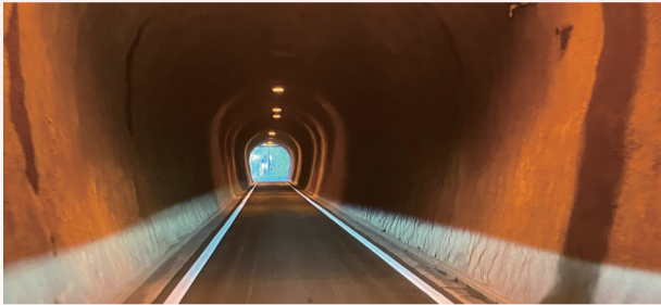
▲双神トンネルは昭和18年竣工。埼玉県管理道路では最も古いトンネルの一つです。(トンネル延長:109.9m)

主要地方道皆野両神荒川線の双神トンネルの舗装工事が終了しました。関係者の皆さんありがとうございました！