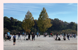
▲子ども達の笑顔がたくさん見られ、素晴らしい大会となりました♪

「第7回秩父市ペタンクジュニア大会」(主催:秩父市青少年育成協議会)が11月4日、別所運動公園競技場で開催されました。季節はずれの暑さのなか、市内小・中学生34チーム・101名の皆さんが熱戦を繰り広げました。