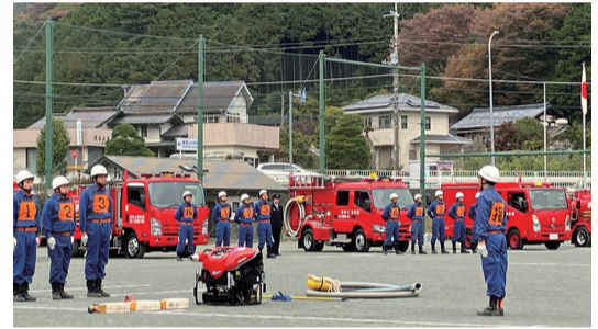
▲東秩父村消防団特別点検の様子